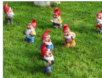
7 7 Zwerge